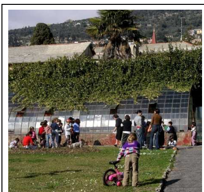
La scuola Perasso durante l'esercitazione di messa a dimora di ciclamini guidata dalla nostra socia G. Lussi

Ancora una volta constatiamo che la salvaguardia dei Parchi non rappresenta una priorità per l'Amministrazione.