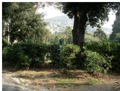
vista dall' ingresso di via Eros da Ros

Si potrebbe iniziare da via Eros da Ros, dove come primo impatto troviamo l'angolo del prato grande di villa Gropallo trascurato e separato dalla rimanente parte del prato da una siepe di pittosforo