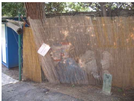
Queste immagini dell'area della piscina e dell'uliveto nel parco di villa Grimaldi ci accompagneranno per tutto l'autunno, l'inverno e la primavera: bidoni, sacchetti contenitori, attrezzature, cavi elettrici pendenti dagli alberi

Ci aspettiamo che venga riportata all'interno del parco l'area della piscina attribuita a Porcinai, ripristinando la visuale dell'uliveto che degrada piacevolmente verso il mare. Uno dei punti più suggestivi dei parchi di Nervi da rivalutare e per il momento, l'unico spazio, oltre la linea ferrata, fisicamente a diretto contatto con i parchi, attraverso i due ponti pedonali.