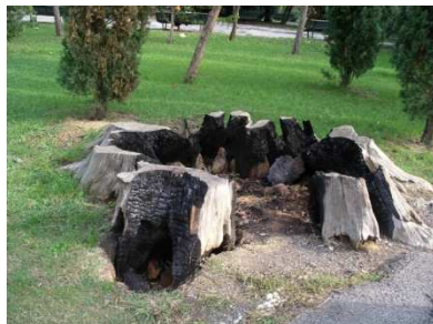
la testimonianza di un antico cipresso, diventata scultura: perché bruciarlo?